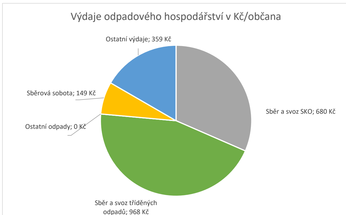
Obr. č. 3: Grafické zobrazení výdajů odpadových kapitol v roce 2024